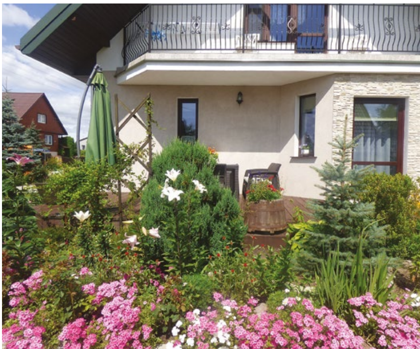
Ogród wiejski - I miejsce - Maryna Prokopowicz, Gródek

Zwycięzcy konkursu otrzymali dyplomy i bony do sklepu ogrodniczego, a laureaci pierwszych miejsc dodatkowo nagrody specjalne – obrazy ma-