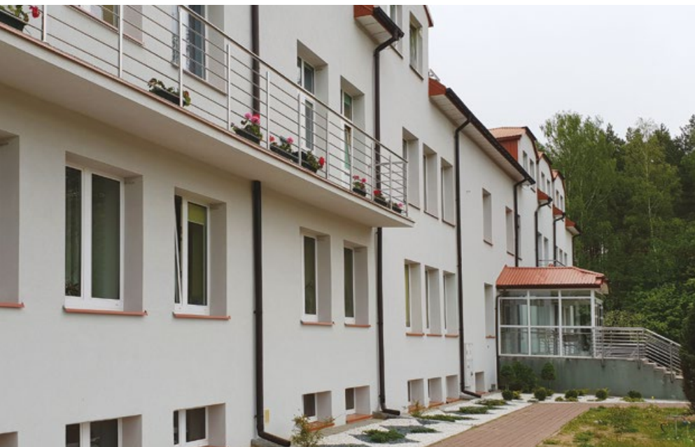
Dom Pomocy Społecznej w Jałowiec