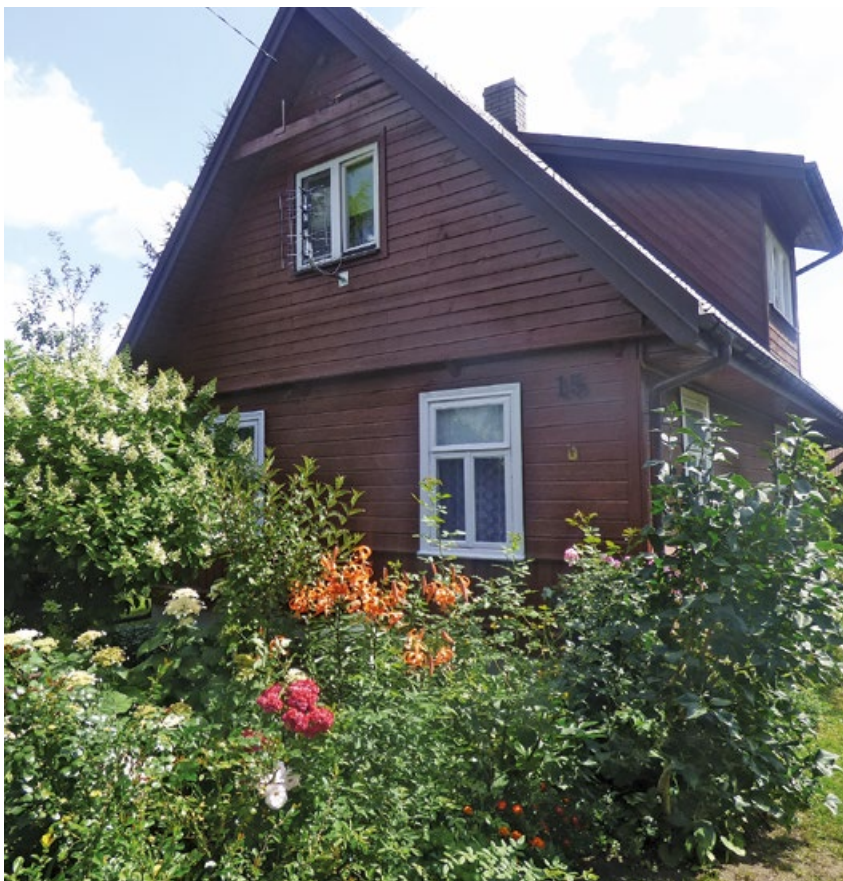
Dekoracje z charakterem - I miejsce - Sławomir Pawłowski, Mostowlany