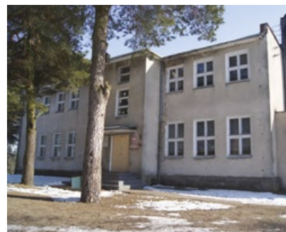
Budynek po szkole podstawowej w Krynickich

– Jeśli pozytywnie zostanie rozpatrzony nasz wniosek to centrum opiekuńczo-mieszkalne będzie miało finansowanie z budżetu państwa – informuje kierownik MOPS w Zabłudowie. – Takie centrum w Krynickich jest bardzo potrzebne, ponieważ na terenie naszej gminy mieszka około 150 osób z różnymi stopniami niepełnosprawności – dodaje Piotr Torbicz. ■